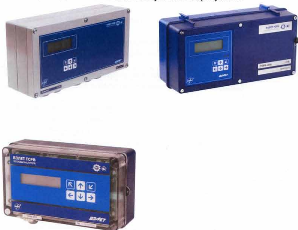
Рисунок 1 - Общий вид тепловычислителей «ВЗЛЕТ ТСПВ»

Общий вид тепловычислителей приведен на рисунке 1.